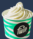
Naturalny Mrożony Jogurt