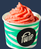
Truskawka Sorbet Wegański