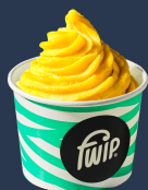
Mango Sorbet Wegański