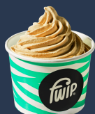
Słony Karmel Gelato